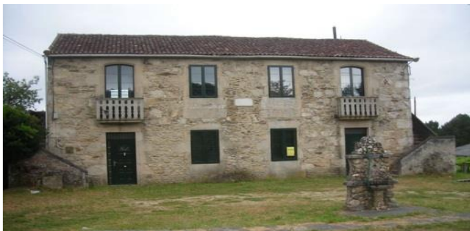
Casa-escola de Arnois