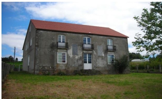
Casa-escola de Calobre

A escola foi construída polos veciños, que contaron coa colaboración do seu sindicato agrario e con doazóns puntuais dos seus conveciños residentes na Habana. Estes, en diversos momentos, enviaron cartos para mercar o equipamento da escola e mesmo o material educativo, como mapas ou estilográficas