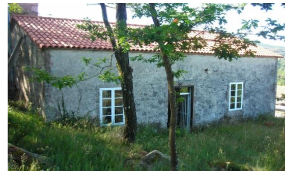
Casa-escola de Curantes

A escola foi construída pola veciñanza a través dunha colecta popular e fixo tamén un chamamento aos veciños residentes na Arxentina. Estes mandáronlles cartos para a compra do soar e para as obras de carpintaría. O mobiliario da escola foi mercado coa doazón dun veciño da parroquia